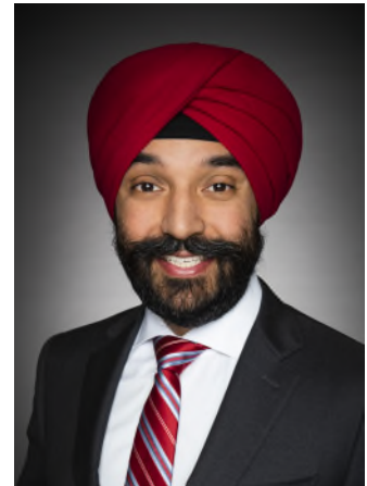
L'honorable Navdeep Bains Ministre de l'Innovation, des Sciences et de l'Industrie

Grâce à toutes ces initiatives et à d'autres encore, nous continuons de réaliser notre engagement d'encourager une économie dynamique et en croissance qui crée des emplois, de nouvelles possibilités et une meilleure qualité de vie pour toutes les Canadiennes et tous les Canadiens.