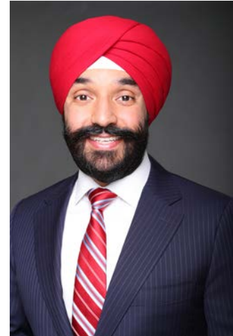
L'honorable Navdeep Bains Ministre de l'Innovation, des Sciences et du Développement économique

De concert avec les Canadiennes et les Canadiens de toutes origines, régions et générations, nous bâtissons une solide culture de l'innovation pour faire du Canada un chef de file de l'économie mondiale.